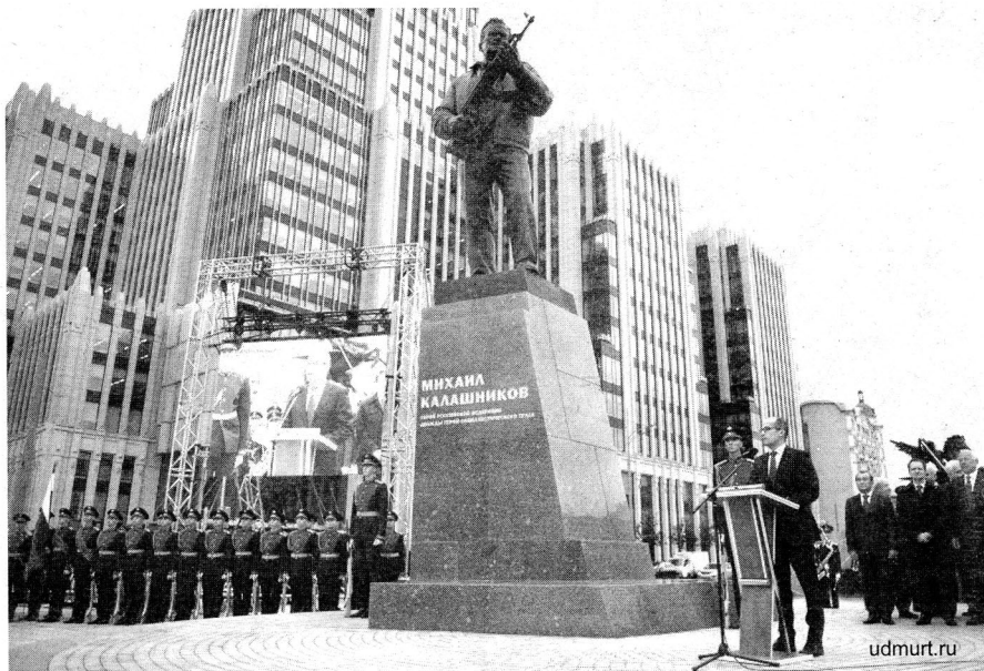
Михаил Калашниковлы Москваын синпелетэз усьтон

12-тй коньывуонэ Россиян ортчоз экономической диктант. Сое Удмуртиын но гожтыны луоз, Ижысь гурт удысья академия радъямъя.