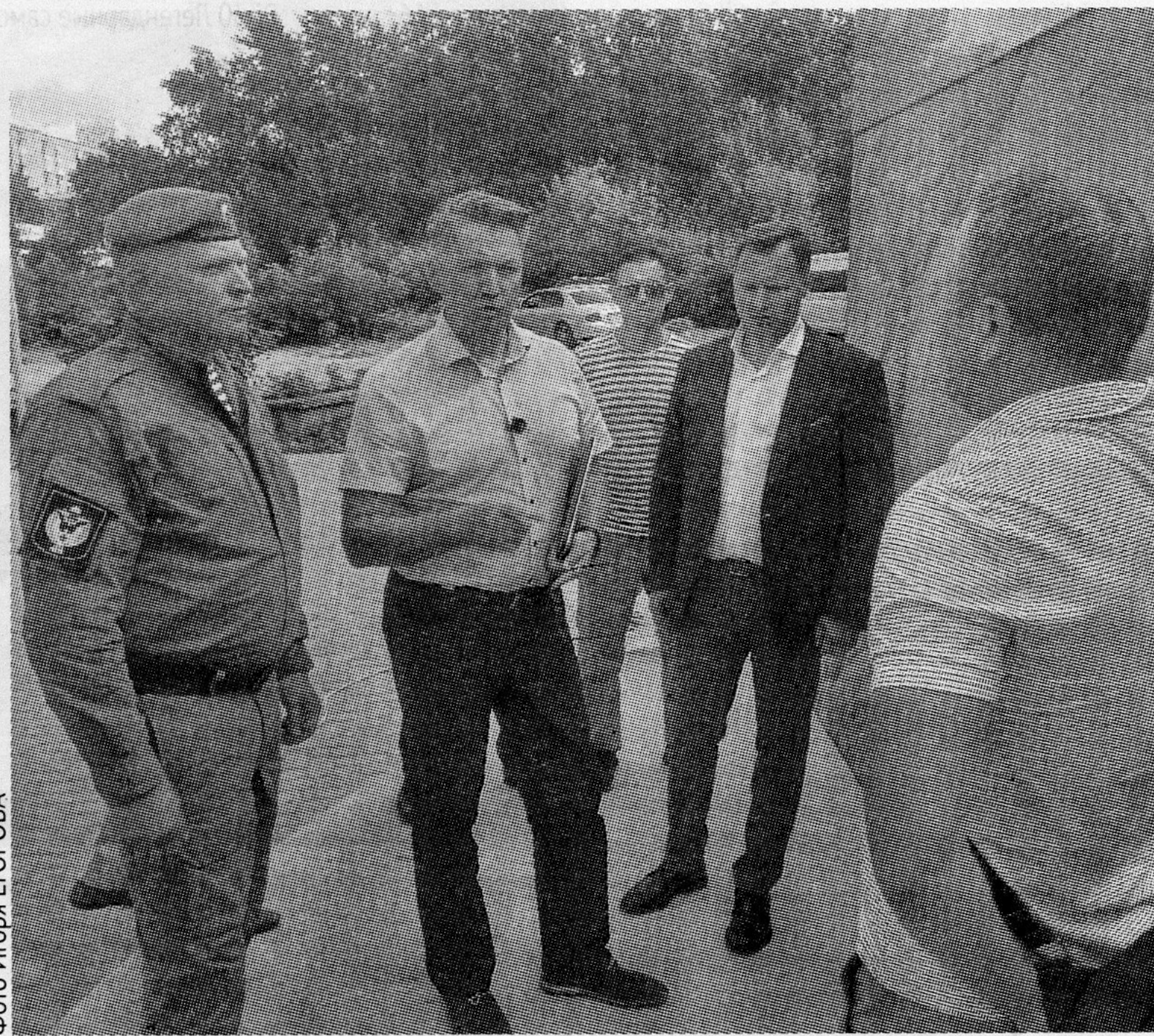
У стелы «Слава ВДВ».